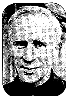
Henri de Lubac